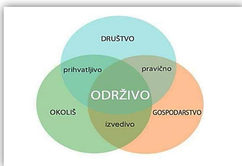
1. Tri sastavnice održivog razvoja

Budući da knjižnice imaju prirodnu ulogu pružanja pristupa informacijskim sadržajima i mrežnim uslugama koje podržavaju održivi razvoj, donositelji odluka trebaju poticati jačanje položaja knjižnica i povećavanje priljeva financijskih sredstava za nabavu i opremanje knjižnica, te iskoristiti vještine knjižničara i drugih informacijskih stručnjaka da se pomogne rješavanje problema razvoja na razini društvene zajednice.