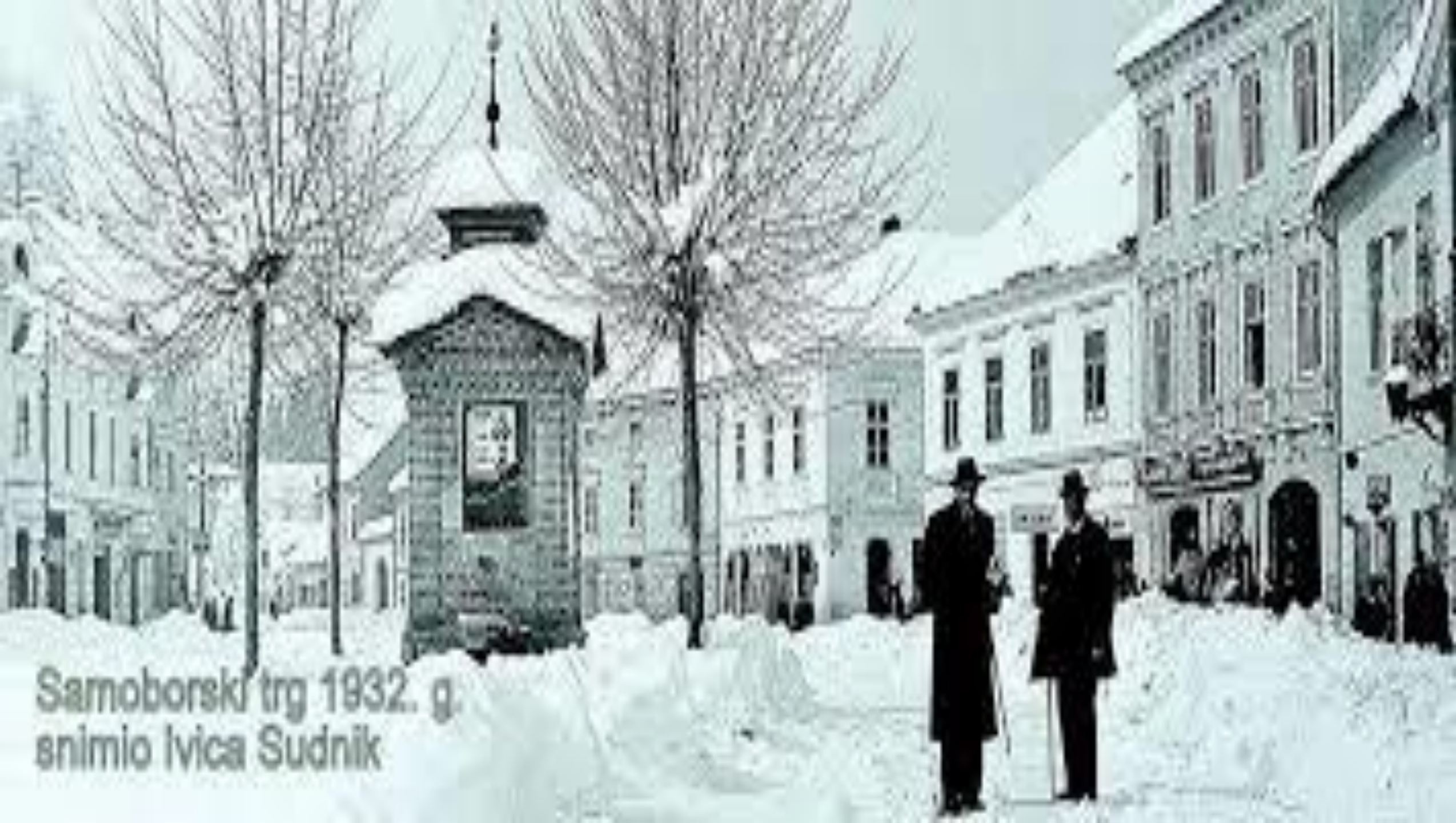
Samoborski trg 1932. g. snimio Ivica Sudnik